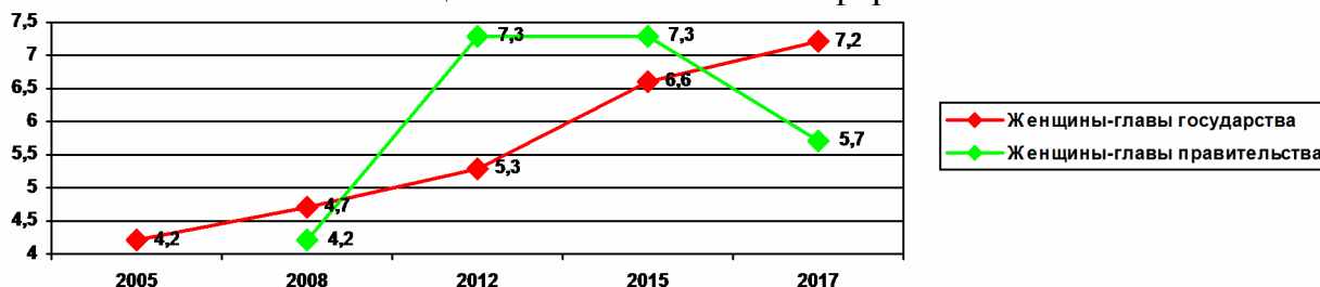
Рис. 2. Женщины-главы государств и правительств (%)

В глобальных рейтингах «Women in politics map 2005 – 2017» опубликованы данные о доле женщин-глав государств в мире и о доле женщин глав парламента (рис. 2), которые позволяют наглядно увидеть динамику изменения положения женщины в политической сфере.